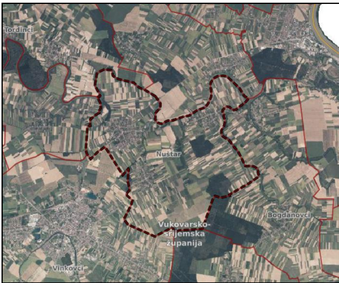
Grafički prikaz 1. Administrativna granica Općine Nuštar

Nakon analize administrativne granice, odnosno obuhvata prostornog plana Općine Nuštar prema podacima dobivenih od Državne geodetske uprave, Središnjeg ureda, Službe za infrastrukturu prostornih podataka iz Registra prostornih jedinica utvrđeno je da se razlikuje od prikazane u trenutno važećem Prostornom planu uređenja Općine Nuštar.