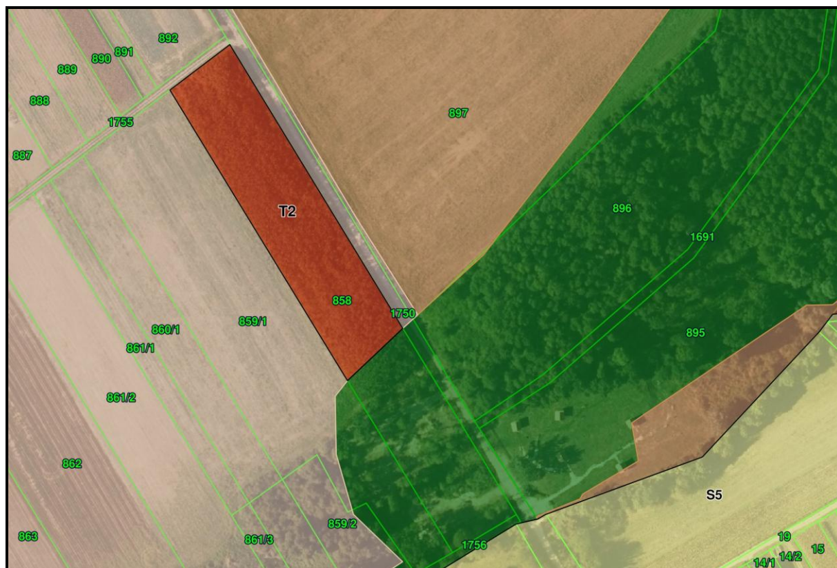
Grafički prikaz 2. Izdvojeno građevinsko područje izvan naselja ugostiteljsko-turističke namjene (T2)